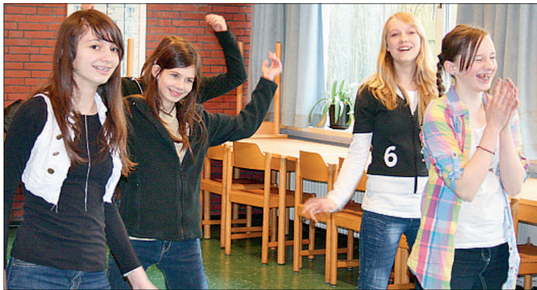
Diese Mädels haben sichtlichen Spaß beim Street Dance.