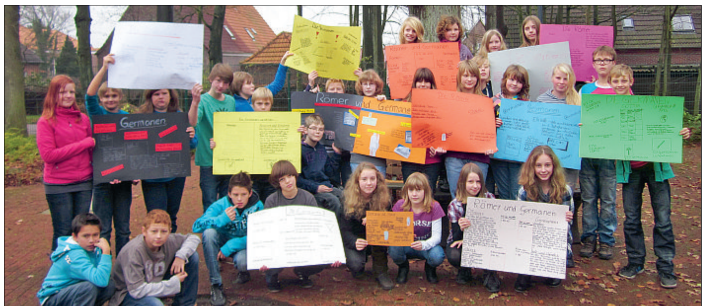
Römer und Germanen: Auf Plakaten haben die KGSler alle wichtigen Informationen zusammengetragen.