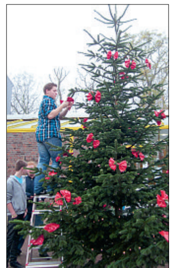
Mit etwas handwerklichem Geschick wurde der Baum zum „Strahlemann“.