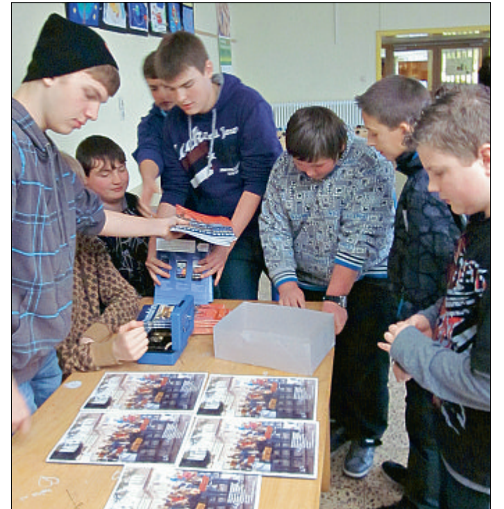
Reißenden Absatz fanden die ersten Exemplare der Schülerzeitung. In den Pausen sorgen die Jungredakteure für den Verkauf.