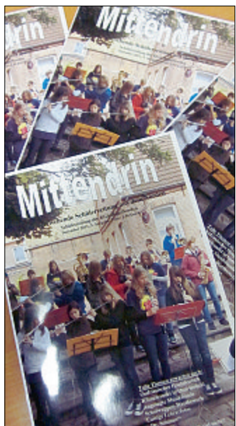
Auch mit der dritten Ausgabe der Schülerzeitung „Mittendrin“ wollen die Hager Jungredakteure ihre Leser überzeugen.