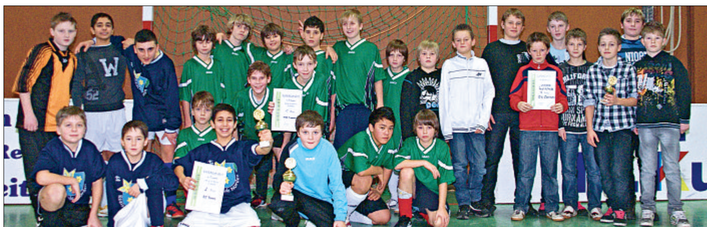
Die Jungen der HRS Krummhörn (Mitte) verwiesen gestern beim Supercup in Dornum die Teams der Realschulen Norden (links) und Dornum auf die Plätze zwei und drei.

„Die Entscheidung fiel in dieser Gruppe auch erst im letzten Spiel“, sagte Mitorganisator Olaf Link. Bis dahin habe die Realschule Norden die Tabelle angeführt. Doch als die Haupt- und Realschule (HRS) Krummhörn auf die Friederikenschule Großheide traf, markierten die Jungen aus der Krummhörn kurz vor Schluss noch den viel umjubelten Siegtreffer zum 3:2 und