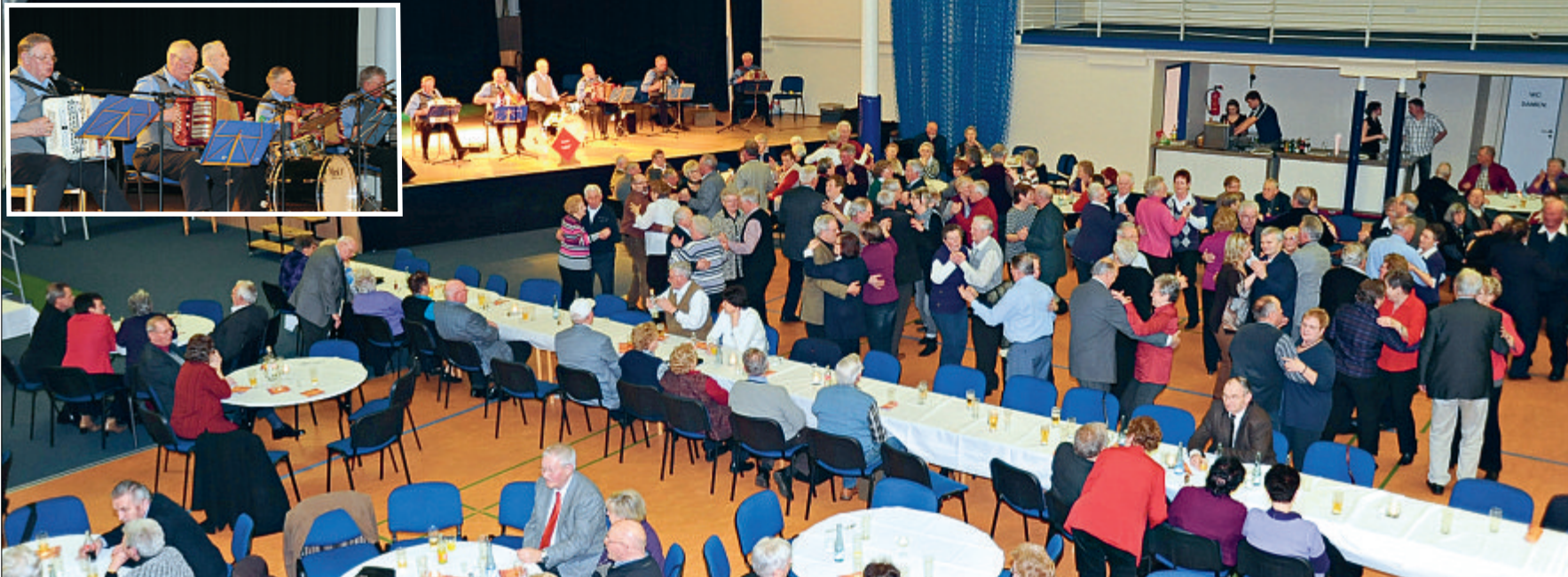
Sehr gut besucht war eine Veranstaltung der „Nessmer Handörgler“ und der „Blersumer Trecksackspöler“ im Familien- und Freizeitzentrum Sturmfrei Neßmersiel. Bevor an dem unterhaltensamen Abend das Tanzbein geschwungen werden durfte, gab es ein gemeinsames Snirtjebraa-Essen. Die Veranstalter zeigten sich mit der Resonanz auf den Abend, der in ähnlicher Form bereits vor einem Jahr stattgefunden hatte, zufrieden.