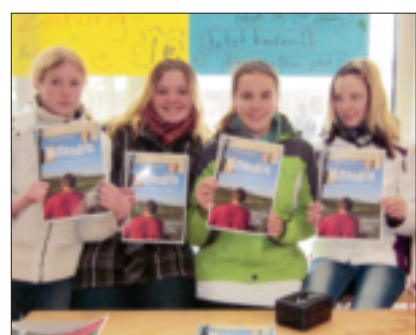
Seit einigen Tagen wird die jüngste „Mittendrin“-Ausgabe verkauft.

Vier Monate arbeiteten die zwölf- bis 14-jährigen Blattmacher an dieser Ausgabe,