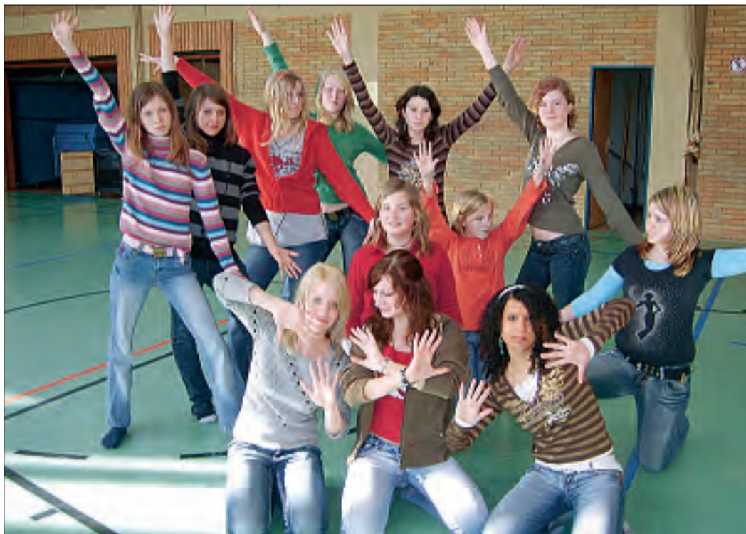
Das Musical-Fieber an der Kooperativen Gesamtschule Hage steigt.

Wer in diesen Tagen die KGS besucht, sollte sich nicht wundern, wenn ihm aus dem Musikraum eine Big-Band-Version von „Hello, Mr. Postman“ entgegenschallt oder