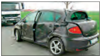
Die Insassen hatten Glück.

WESTERACCUM – Glück im Unglück hatten Urlauber auf der Kreisstraße 243 in Westeraccumersiel, als sie gestern Vormittag gegen 10 Uhr mit ihrem Auto in eine Feldzufahrt nach links abbogen und dabei frontal seitlich von einem überholenden Lastwagen erfasst wurden. Fahrer und