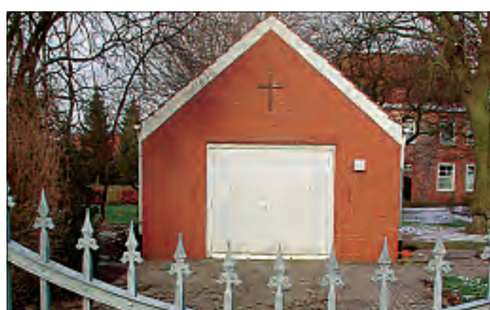
In schlechtem Zustand: die Dornumer Leichenhalle.