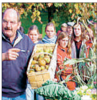
Erntegaben vom Feld und aus dem Garten.