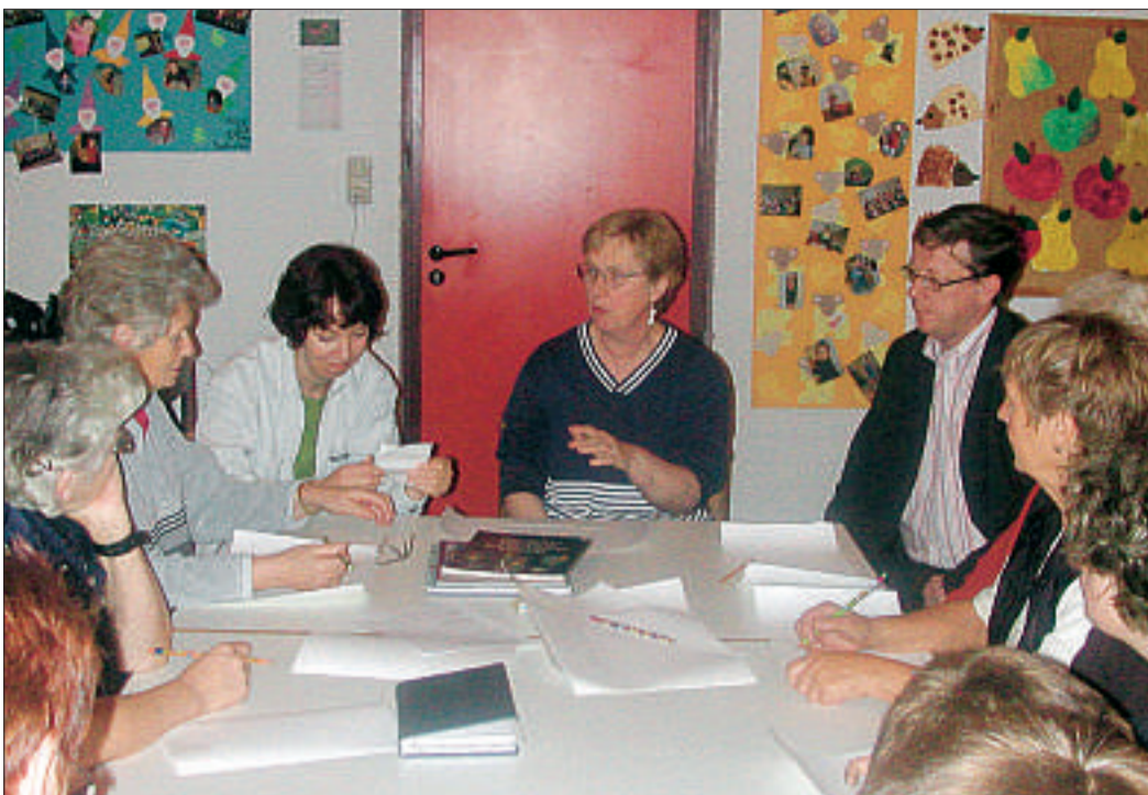
Die Reise der Jünger nach Emmaus wollen die Leezdorfer auf Buntglasfenstern darstellen.

Interessierte können jederzeit dazukommen. Informationen gibt Pastor Riesebeck unter der Nummer (04934) 6999.